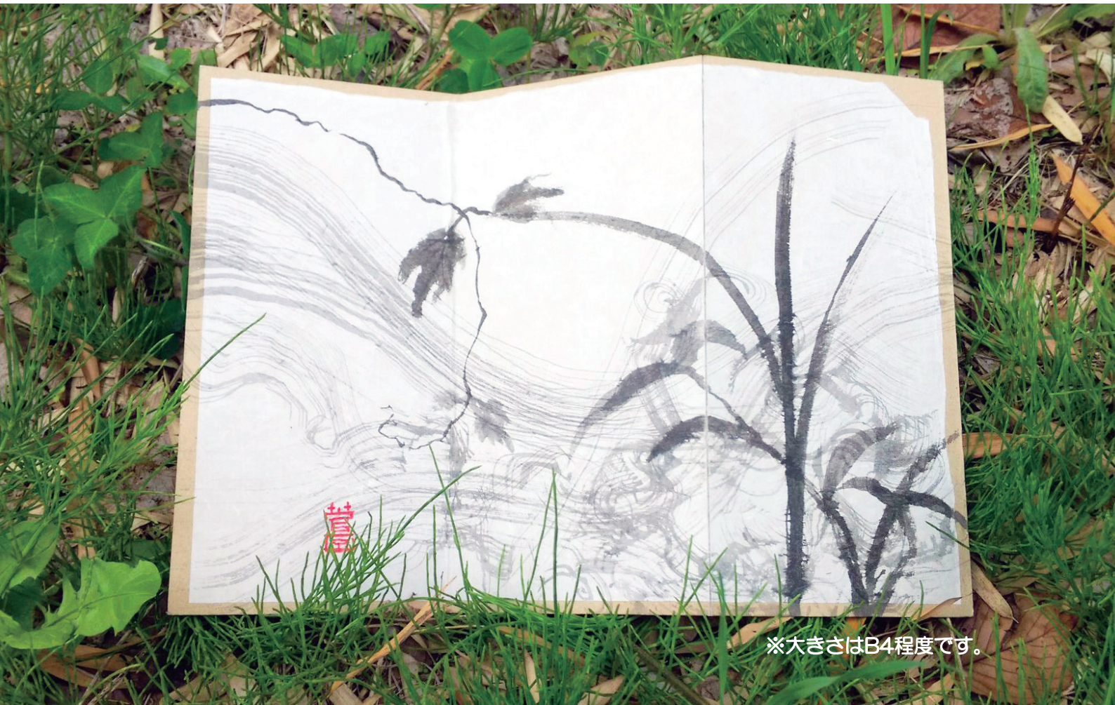
※大きさはB4程度です。