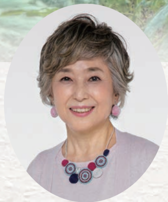
竹下 景子