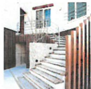
NAGOYA MODEL HOUSE