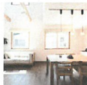
URAYASU MODEL HOUSE