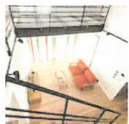
TAKAMATSU MODEL HOUSE