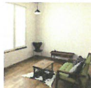
ANJO MODEL HOUSE