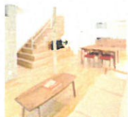
OSAKA IZUMI MODEL HOUSE