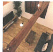
HIROSAKI MODEL HOUSE