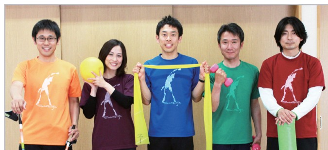
健康運動指導士・健康運動実践指導者