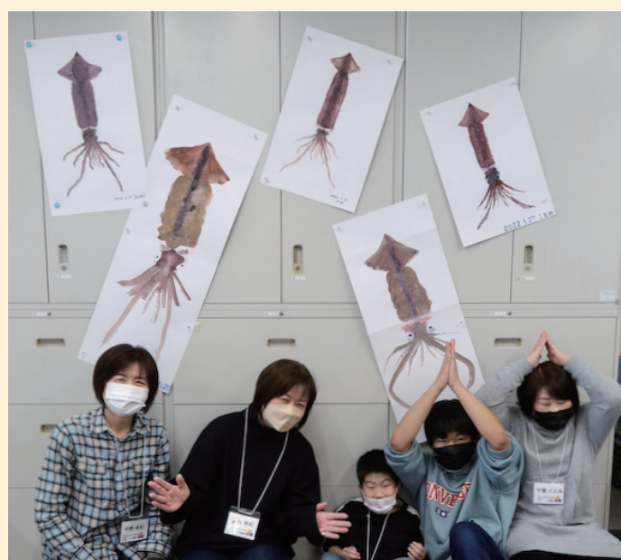
←「イカ」を美味しそうに描いたみなさん