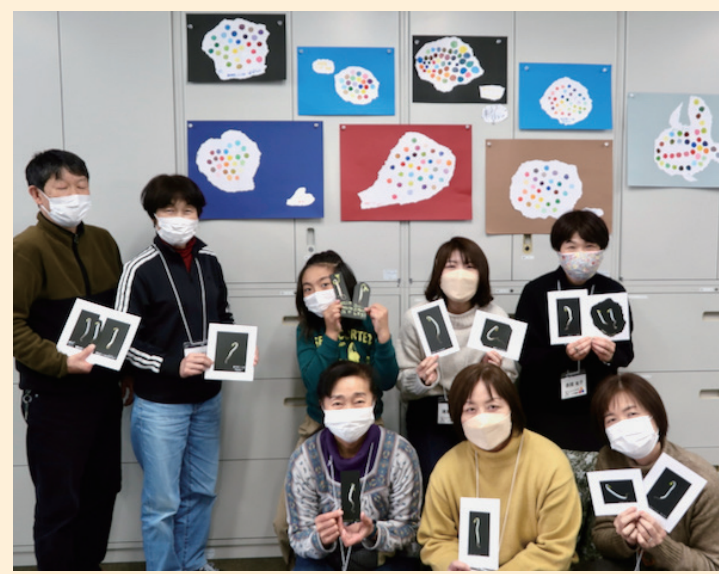
↑「色づくり」と「もやし」に参加したみなさん