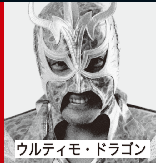
ウルティモ・ドラゴン