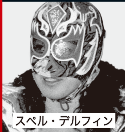
スペル・デルフィン