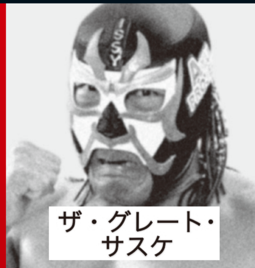
ザ・グレート・サスケ