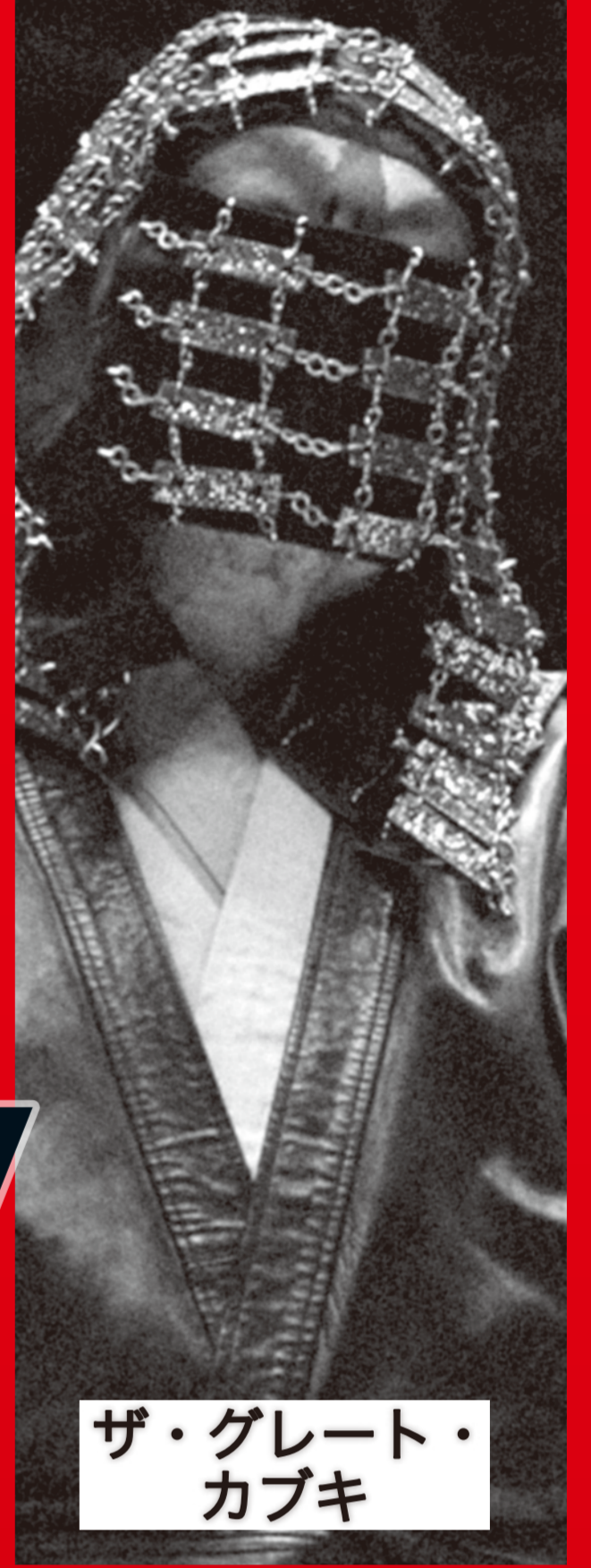
ザ・グレート・カブキ