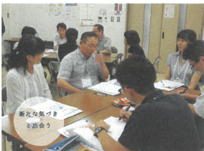
多賀城市で座学・ディスカッション

エクスカージョン @ 七ヶ浜町。七ヶ浜の活動者からお話を聞いたあと、発表会に向けて自分の想いや考えをまとめました。