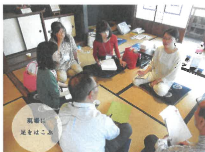
塩釜市でエクスカージョン