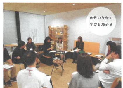
利府町で交流会・ディスカッション

※申込みの際にお預かりした個人情報は、本講座のご連絡またはセンター事業のご案内にのみ使用させていただきます。